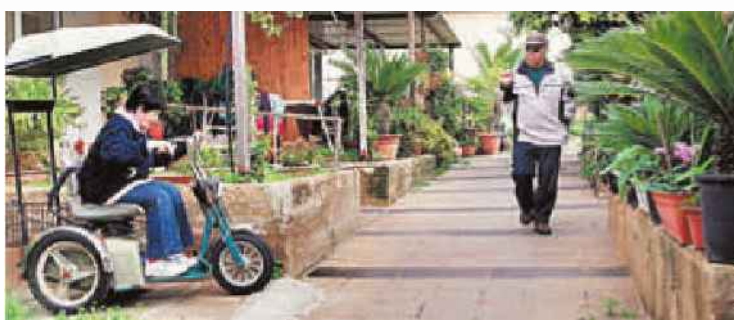
קיבוץ גבעת ברנר. יהפוך לגדול ביותר

דו"ח לוי באוגוסט האחרון הגיש קיבוץ מעגן מיכאל עתירה לבג"ץ בטענה שהמדינה מתעלמת מצרכיו ואינה ממלאת את מחויבותה לעדכן את לוח 2 – הלוח בתוכנית המי"תא הארצית שקובע לכל קיבוץ ומושב בישראל את מכסת היחידות הדיור המותרת לו. במעגן מיכאל, מהקיבוצים הגדולים והעשירים בארץ, נתקעו על מכסה של 600 יחידות דיור, ולמרות הגידול הטבעי של הקיבוץ ורשימת המתנה ארוכה של בני קיבוץ שביקשו לחזור ולהיקלט בו, הקיבוץ אינו יכול להרחיב את היקף הדירות בתחומיו בשל אותה התנגשות עם תמ"א 35. בעתירה טען הקיבוץ כי למרות חובת העדכון של הלוח בכל ארבע שנים, המדינה נמנעה מכך גם ב-2009 וגם ב-2015. היות שבקיבוץ ביקשו להגדיל את מספר הדירות ל-900, הם נאלצו לעתור לבית המשפט. כעת הבינו במטה הדיור כי אין ברירה אלא לעדכן את מספר הדירות בקיבוצים ולאפשר את גדילתם גם במענה לצורך בהגדלת מספר הדירות ברמה הארצית.