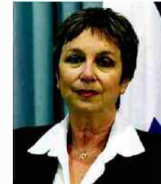
השופטת אנה שניידר. חשיבות המידע

לא ייחשף שמה של חברת קיבוץ נחשון שהי חליטה לפנות אל מקבלי ההחלטות בקיבוץ צה ולהביע הסתייגות מהשכרת דירה לאדם מסוים. זה האחרון תבע פיצויים בסך 176,150 ש"ח מנ"ח שון ומנושאי משרה בו, בתביעה שהגיש לבית משפט השלום בירושלים באמצעות משרד עורכי הדין "אסף הורניק ושות'". לטענתו, "גורמים שלישיים עלומי שם דיברו עליו סרה ופגעו בשמו הטוב, ובעקבות שמועות אלה החליט הקיבוץ שלא להשכיר לו דירה". 100 אלף ש"ח מתוך התביעה הם דרישה לפיצוי בגין לשון הרע, ומכאן ברור מדוע ביקש התובע לדעת מיהי החברה שאמרה, לכאורה, מה שאמרה ("לחשוף את המקור", ידיעות הקיבוץ 5.7.2013).